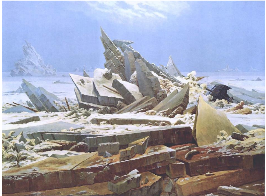
“Das Eismeer” von Caspar David Friedrich