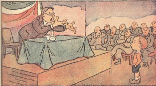
3. Ma poi sente un oratore predicar con gran fervore: « Basta ormai con l'applaudire! Or dobbiam ricostruire ».