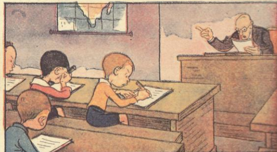
8. Sì, ma ascolti una parola: sei sui banchi della scuola ei potrà collaborare al gran compito. Studiare!